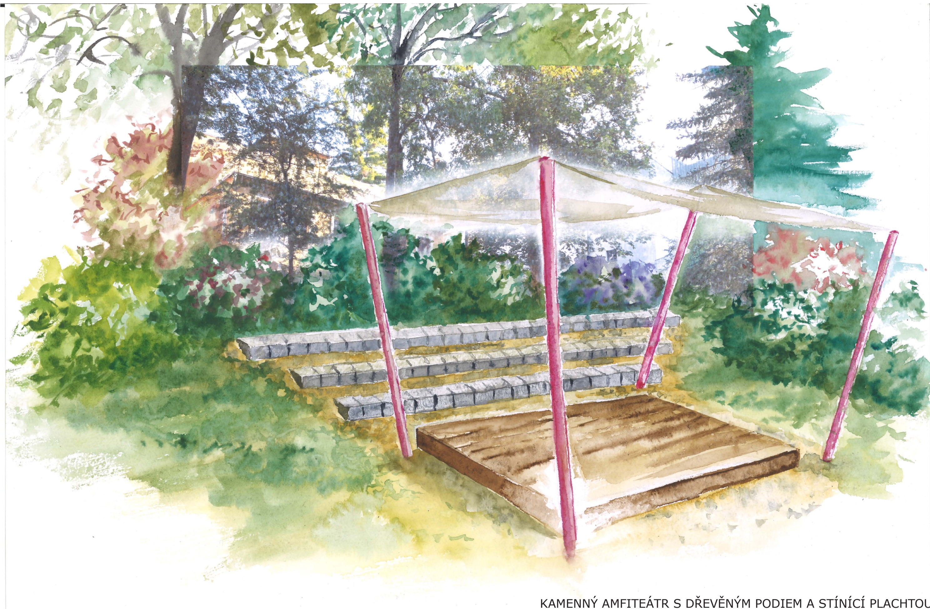
KAMENNÝ AMFITEÁTR S DŘEVĚNÝM PODIEM A STÍNÍCÍ PLACHTOU