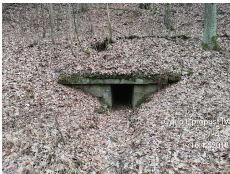
2 - čelo propustku naplaveniny na římse degradace zdiva a spár.jpg