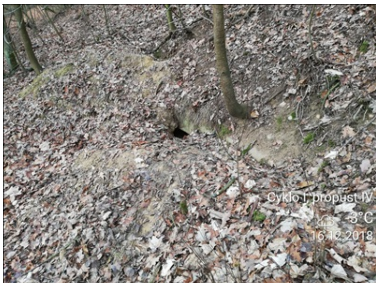
5 - detail římsy.jpg