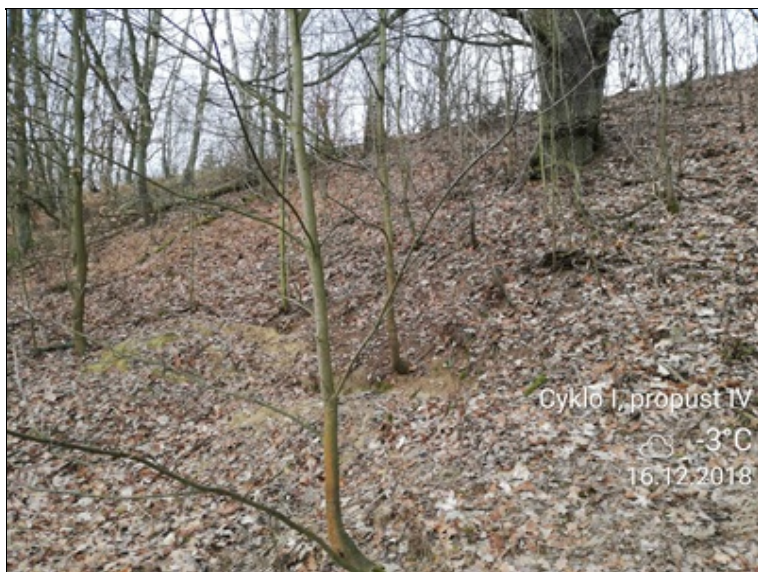
4 - zcela zasypán otvor propustku nežádoucí vegetace.jpg