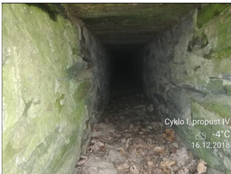
3 - pohled do otvoru propustku degradace zdiva.jpg