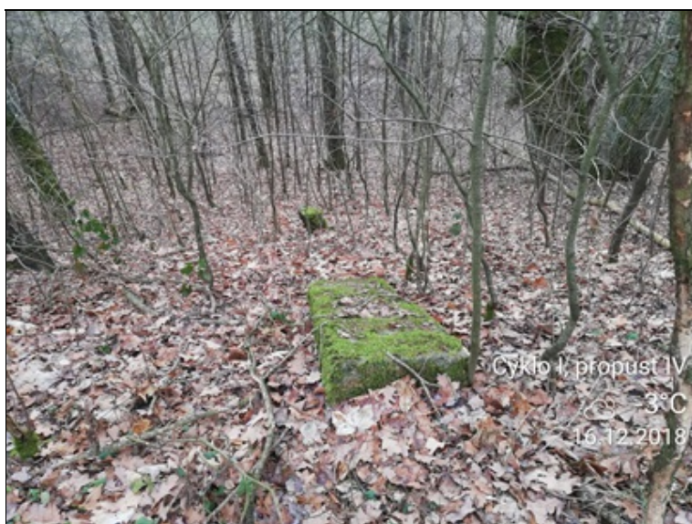
6 - pohozený původní patník.jpg