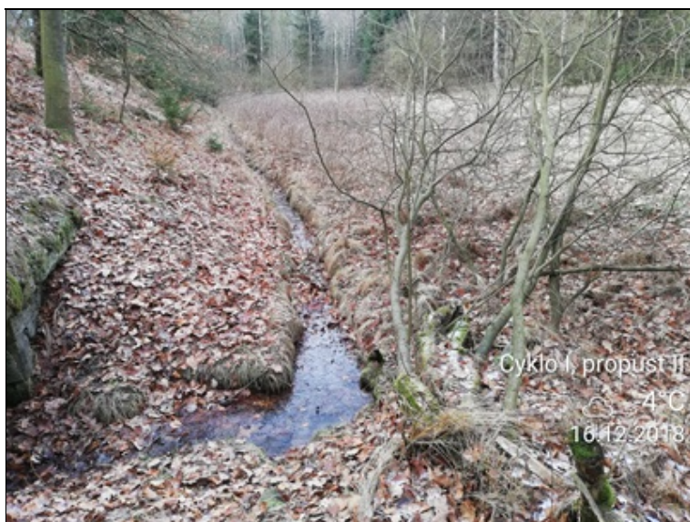
3 - nežádoucí vegetace.jpg