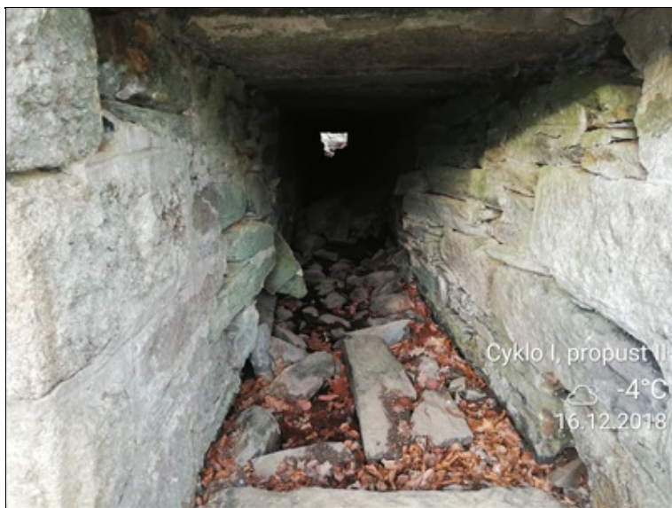
5 - zřícená podpěra.jpg