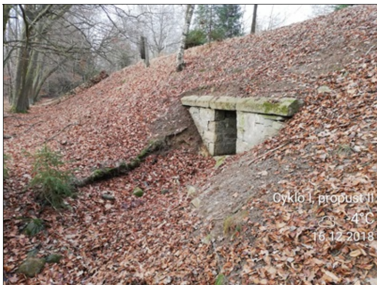
4 - pravé čelo propustku.jpg