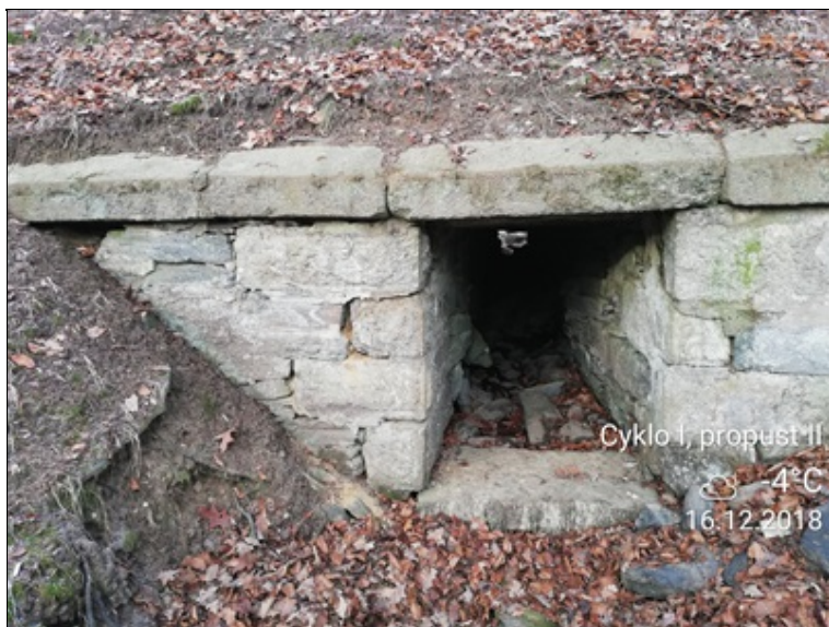
7 - uvolněné zdivo.jpg