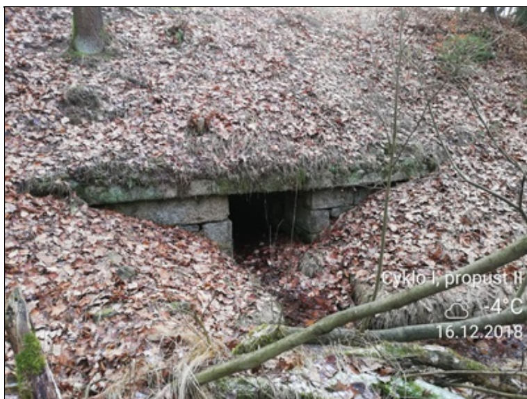
2 - pohled na čelo propustku nežádoucí vegetace na římse vydrolené spáry.jpg