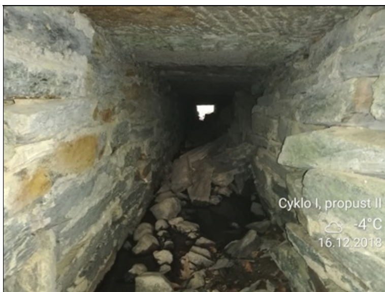
6 - zřícená podpěra.jpg