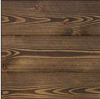
TMAVĚ HNĚDÁ LAZURA - DŘEVĚNÝ PODHLED, KROV