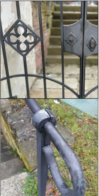
MŘÍŽ / ZÁBRADLÍ KOVANÉ - KOVÁŘSKÁ ČERŇ