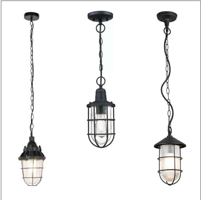
STROPNÍ ZÁVĚSNÉ SVÍTIDLO