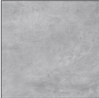
POHLEDOVÝ BETON - PORTÁL, ŽB VĚNEC