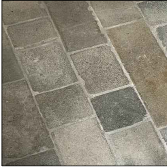
ŽULA - DLAŽBA, SCHODY